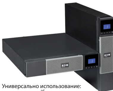
Универсально использование: для стоек/башенное