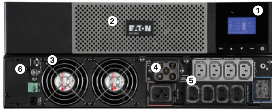
Eaton 5PX 3000i RT2U